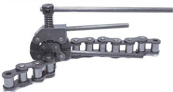
Extractor de eje de cadenas réf 16916050 Cadenas simples, dobles, triples al paso de 19,05 & 31,75mm ISO & ASA